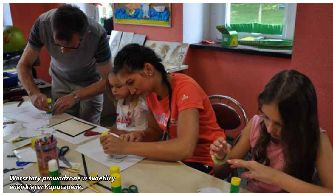
Warsztaty prowadzone w świetlicy wiejskiej w Kopaczowie.