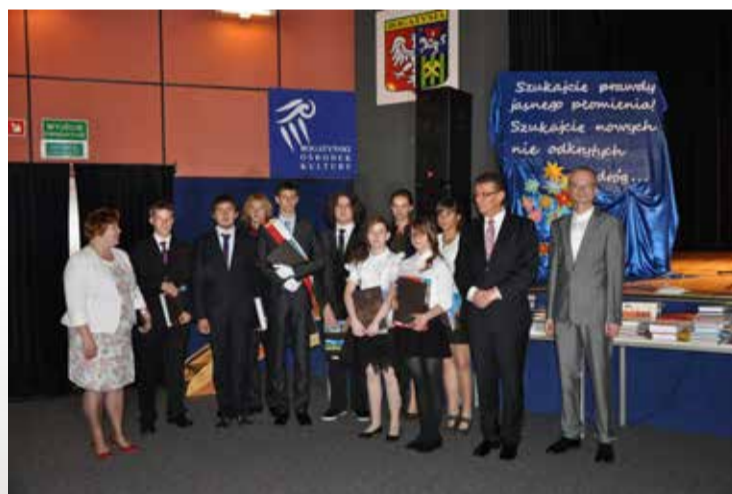
Fot. UMIG Bogatynia