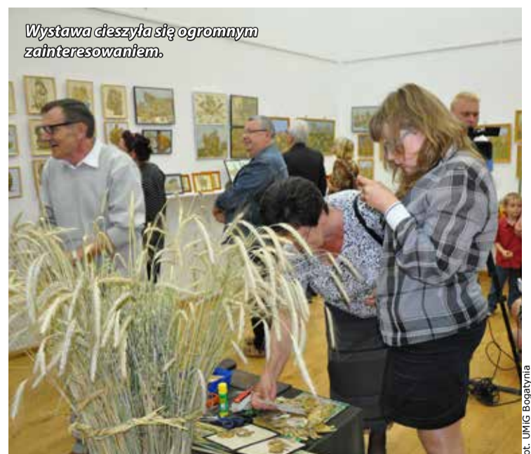
Wystawa cieszyła się ogromnym zainteresowaniem.