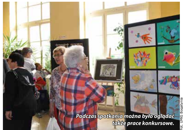
Podczas spotkania można było oglądać także prace konkursowe.

Prace Rafała Bojanowskiego wielokrotnie były publikowane i nagradzane przez portale branżowe.