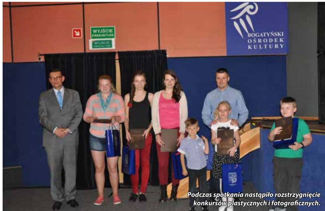
Podczas spotkania nastąpiło rozstrzygnięcie konkursów plastycznych i fotograficznych.